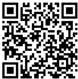
Фото и видео доступны по ссылке: cloud.mail.ru/public/vBHB/aBVMTotXM